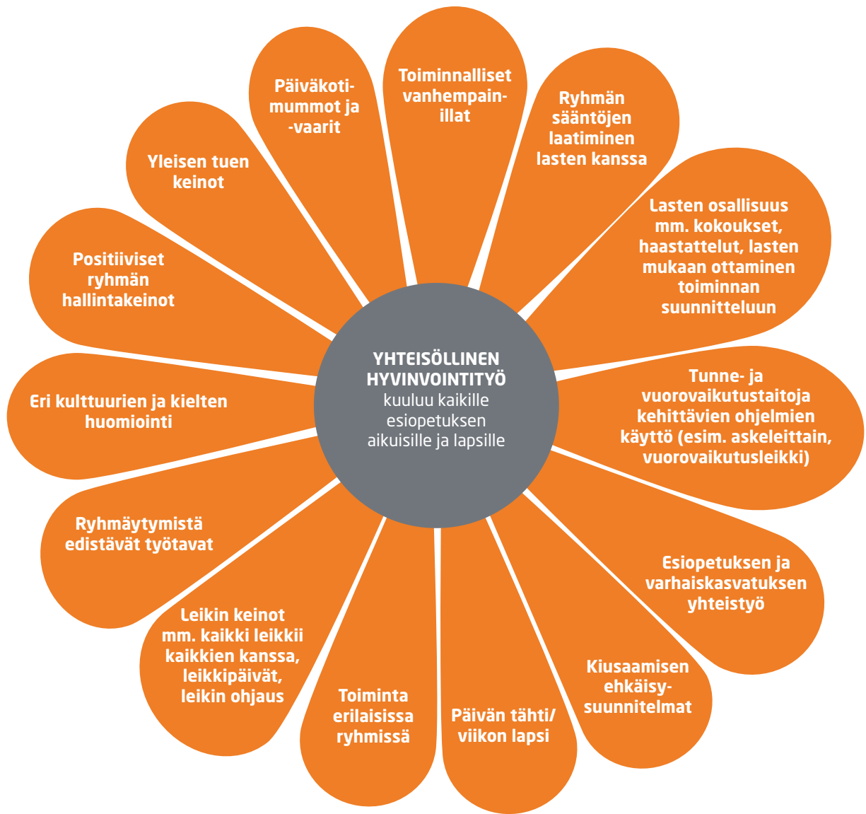
KUVIO 1. Toimintatavat, joilla arjen hyvinvointityötä voidaan Mikkelin esiopetuksessa toteuttaa.