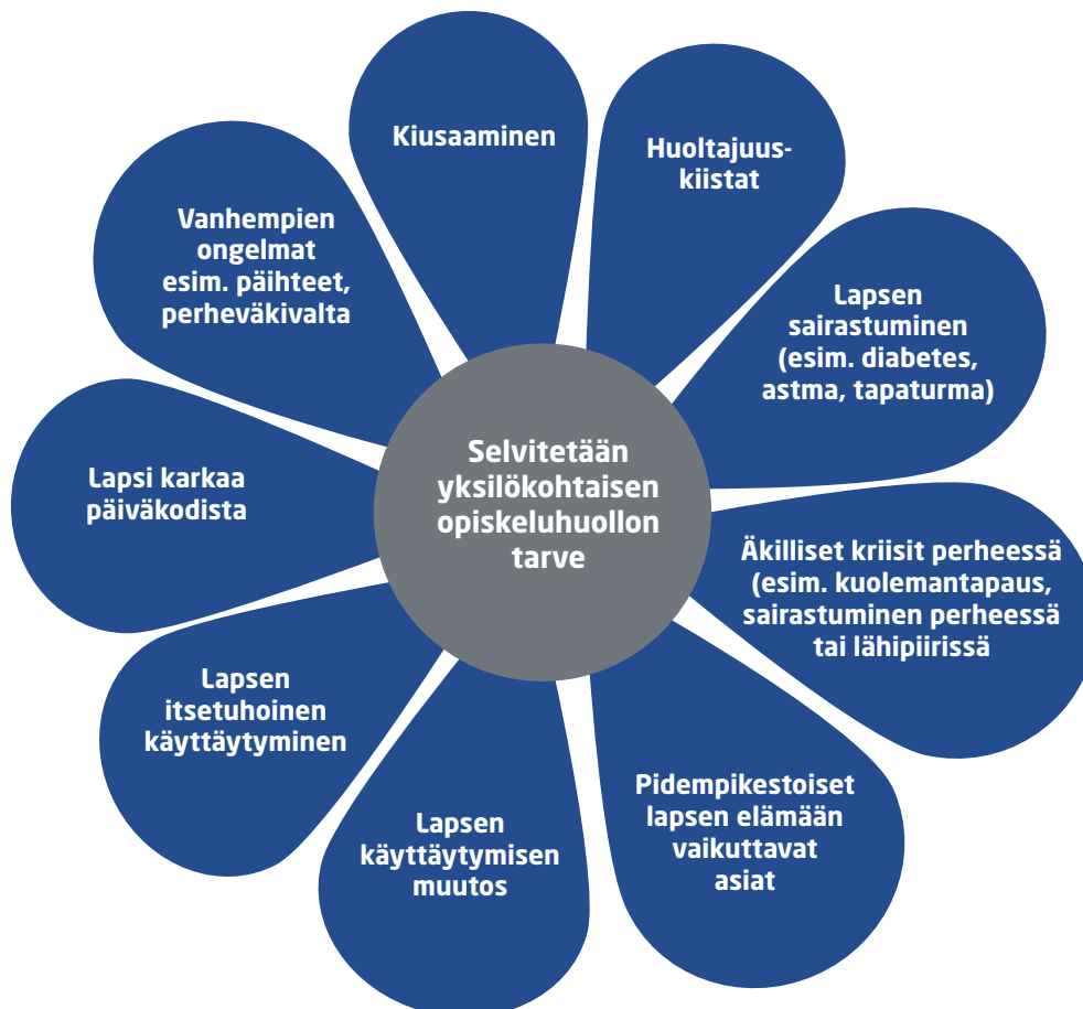
KUVIO 2. Tilanteita, joissa on tarpeen selvittää yksilökohtaisen opiskeluhoollon tarve esiopetuksessa.

Kuviossa 2 esitetään tilanteita, joissa on tarpeen selvittää yksilökohtaisen opiskeluhoollon tarve esiopetuksessa.